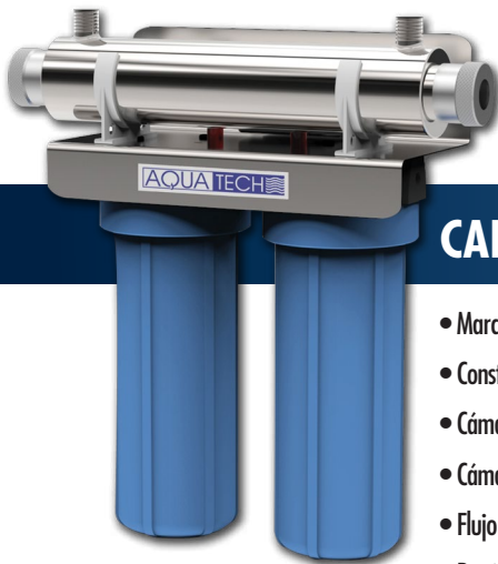
UV-17-2 WATER PURIFICATION SYSTEM